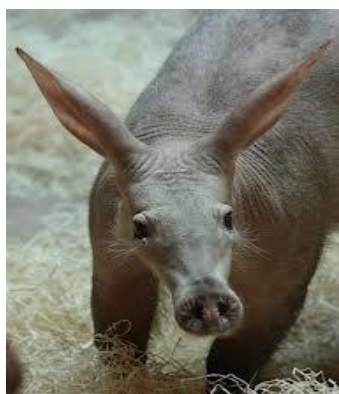
sadulaid, käevõrusid jms. Mis selts ja mis loom?