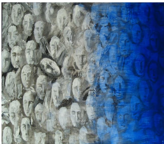
Üksinda teiste seas