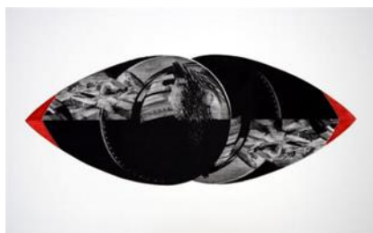
Lõikumised III, 2010

Graafik, sündinud 1945. aastal Tallinnas. Õppis aastatel 1964-70 ERKI-s. Töötanud Tallinnas 1970–78 kirjastuse Eesti Raamat mittekoosseisulise kunstnikuna, seejärel vabakunstnikuna. Aastast 1973 Kunstnike Liidu liige. Alustas omapärasel tehnikas kuivnõelagravüüridega, millel kujundid moodustuvad paralleeljoontest. Iseloomulikud on kujutatava täpne edasiandmine ja romantiline tundetoon. Aastast 1985 on peamine koloreeritud värvilito, kujutusviis on muutunud üldistavamaks ja dekoratiivsemaks, lisandunud on arhitektuurivisioonid. Näitused alates aastast 1970.