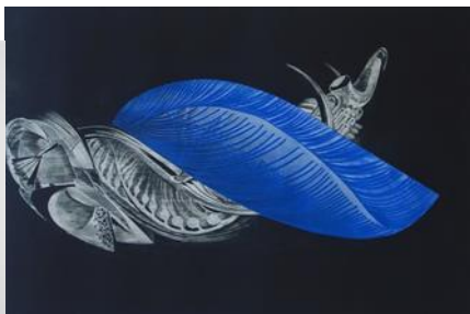
Sümbioos I, 2005