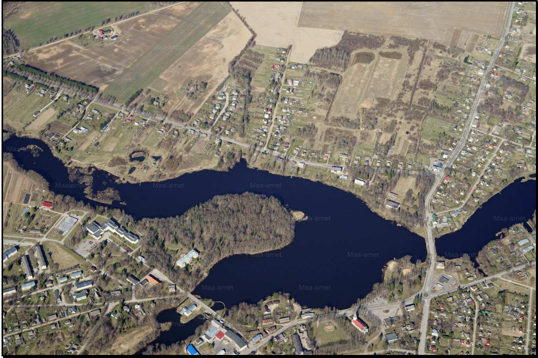
Aerofotol on näha fragment ühest Eesti linnast. Millisest? ↑